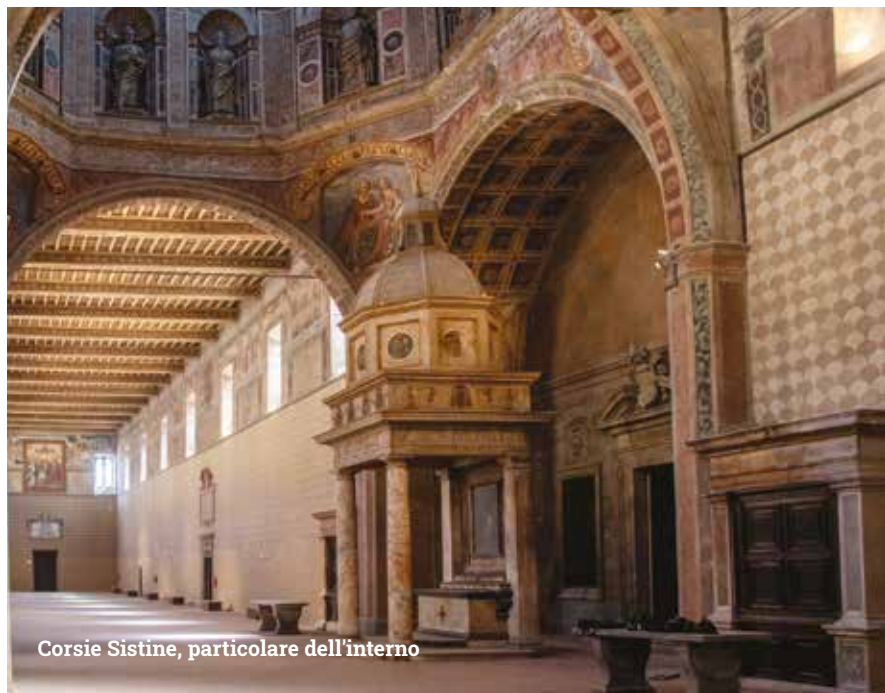
Corsie Sistine, particolare dell'interno

L'Ospedale Santo Spirito in Sassia, aderente alla Associazione Culturale degli Ospedali Storici Italiani (ACOSI), per la sua storia pluricenteneraria, la bellezza architettonica e la sua posizione si presta magnificamente ad ospitare l'evento, quasi incarnandone lo spirito più profondo: la bellezza, il patrimonio culturale e la memoria sono la cura