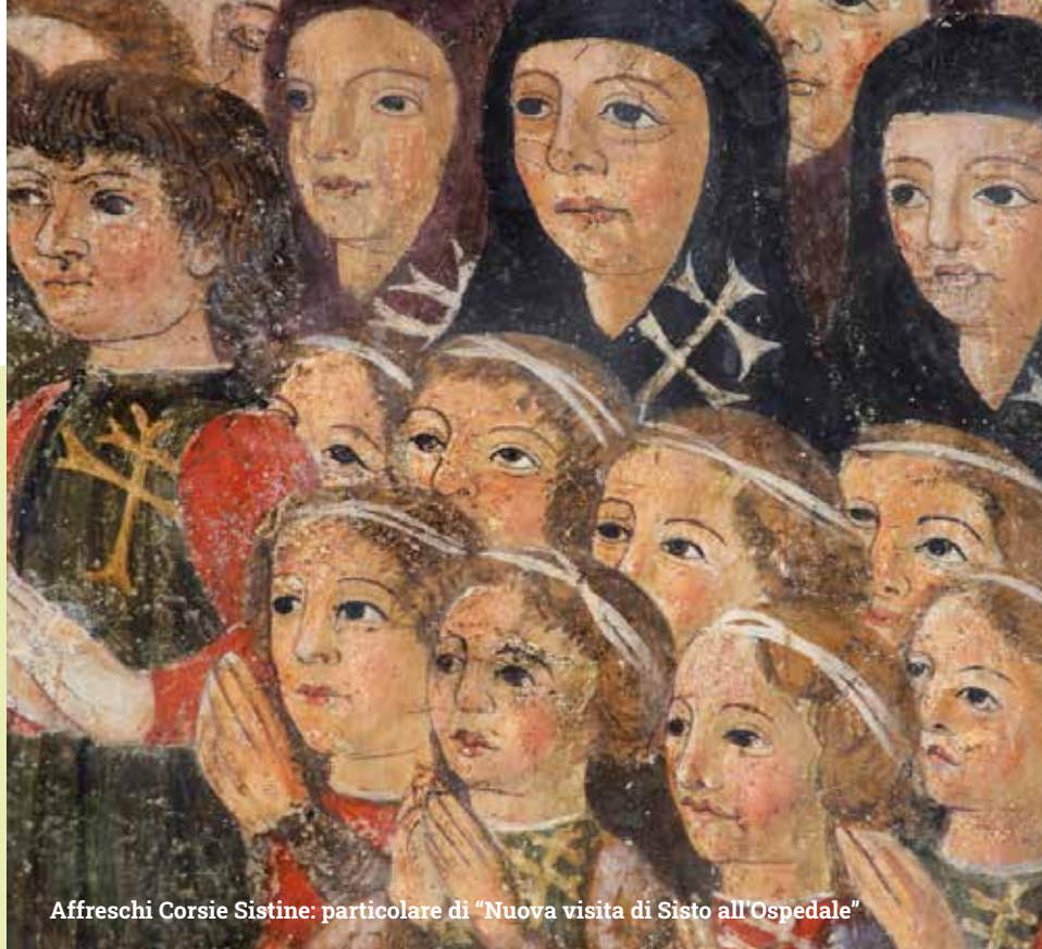
Affreschi Corsie Sistine: particolare di "Nuova visita di Sisto all'Ospedale"