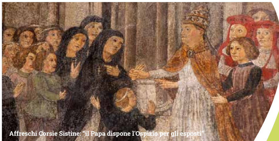
Affreschi Corsie Sistine: "il Papa dispone l'Ospizio per gli esposti"

Personalità dell'Arte, della Cultura e della Scienza ci racconteranno perché e quando, per esperienza diretta, si sono accorti che attraverso la cultura si può vivere meglio